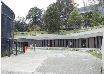
Edificio Cultura y su plazoleta