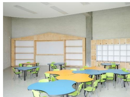
Aula Jardín infantil