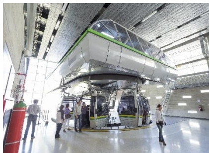
Línea H. Estación la Villa Sierra