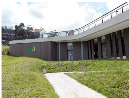
Edificio INDER, comedor y aulas para guarderías

El portal especializado en arquitectura, ArchDaily seleccionó a las Unidades de Vida Articulada (UVA) de Medellín como una de las obras más relevantes durante el año 2016, además de estar entre los diez mejores proyectos de arquitectura global.