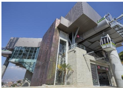
Línea H. Estación las Torres

Se destaca la generación de más de 2000 empleos directos e indirectos de personal de obra y calificado de la Región, lo que demuestra el compromiso de la constructora con el crecimiento del empleo en Antioquia. Más información de esta noticia AQUÍ